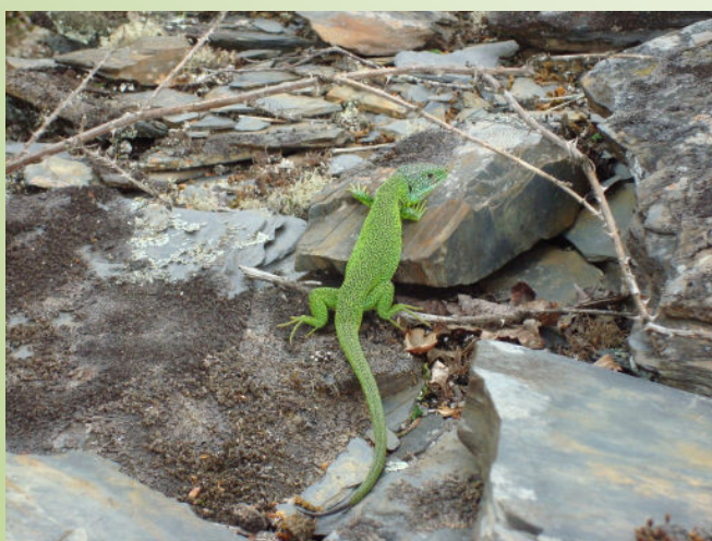
Lézard vert (C. Bouju)